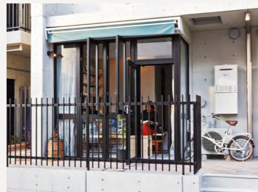
外からアクセスできるSOHO型住宅はWEBデザイナーが入居