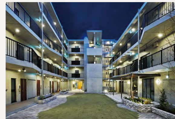
住民がさまざまなコミュニケーションを交わす、多目的使用が可能な中庭