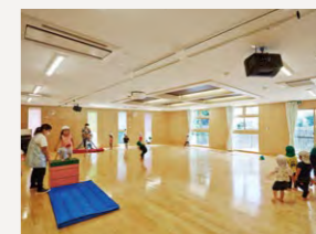
10mスパンが確保された2階遊戯室