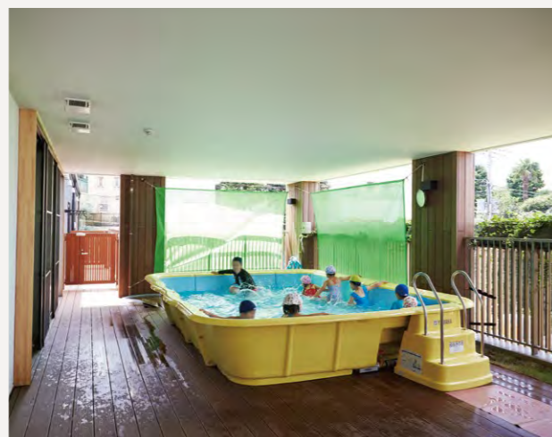
保育室とフラットに繋がる2階バルコニーに設置されたプール。奥行きのあるバルコニーは雨の日も外遊びができ、園児・保育士ともに好評