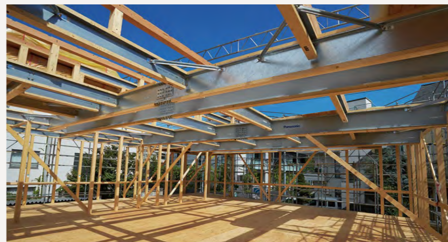
テクノビームが剛接合されている上棟時の2階遊戯室