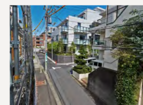
幅員が4mの狭い搬入路