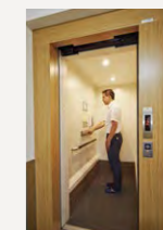
車椅子対応の小型エレベーター