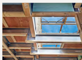
2階バルコニーと保育室をフラットに支える段差テクノビーム