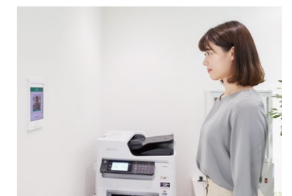
複合機のログインも顔認証で実施