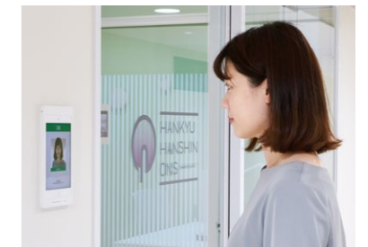
エントランスに設置された 顔認証による入退管理システム