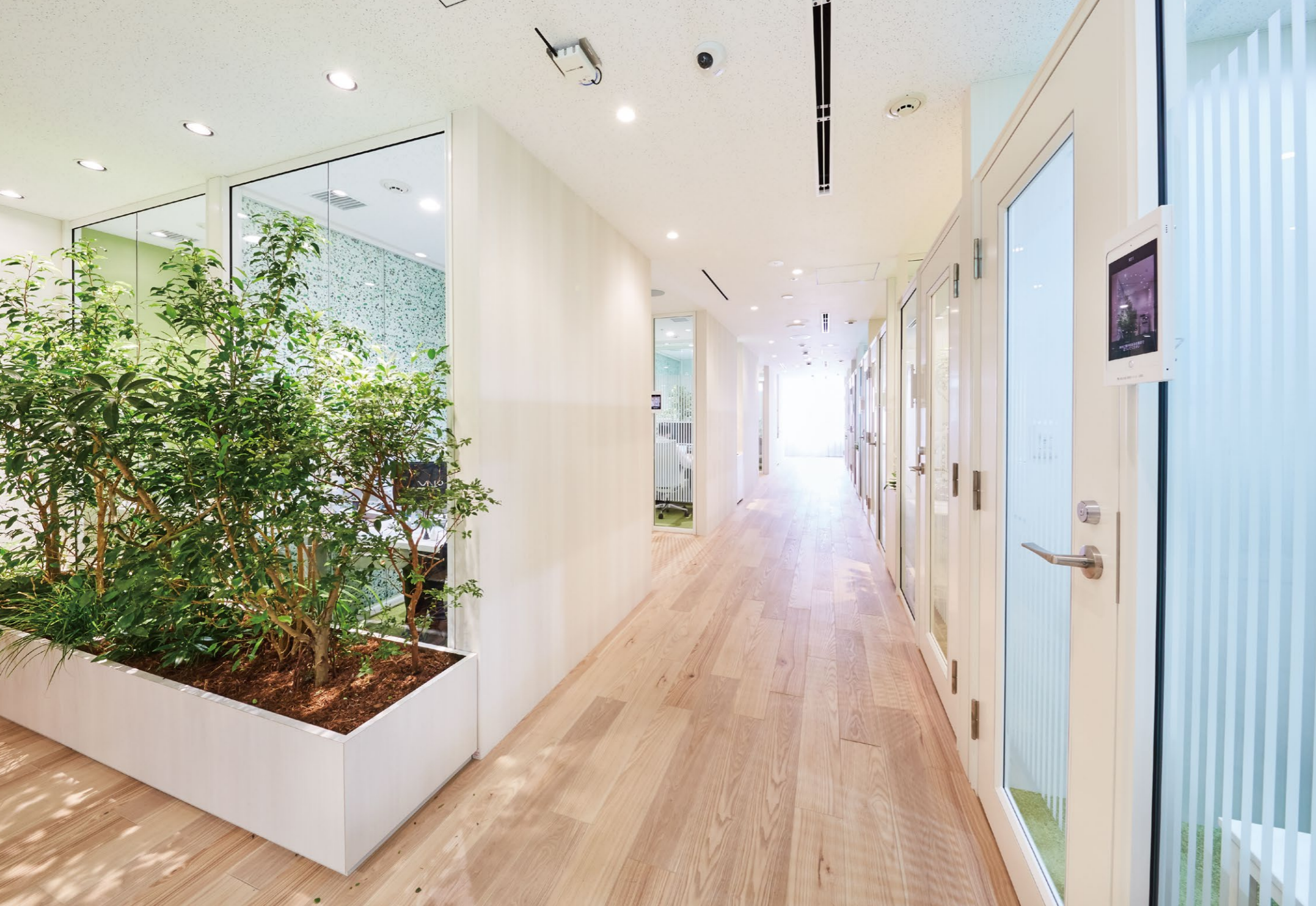
顔認証で入室できる17個の個室が配置されたサテライトオフィス