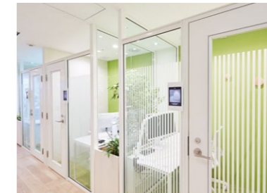
ガラスパーティションで仕切られた個室が並ぶ