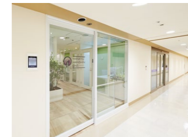
サテライトオフィスのエントランス