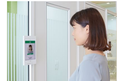
個室は予約している個人を特定して解錠する