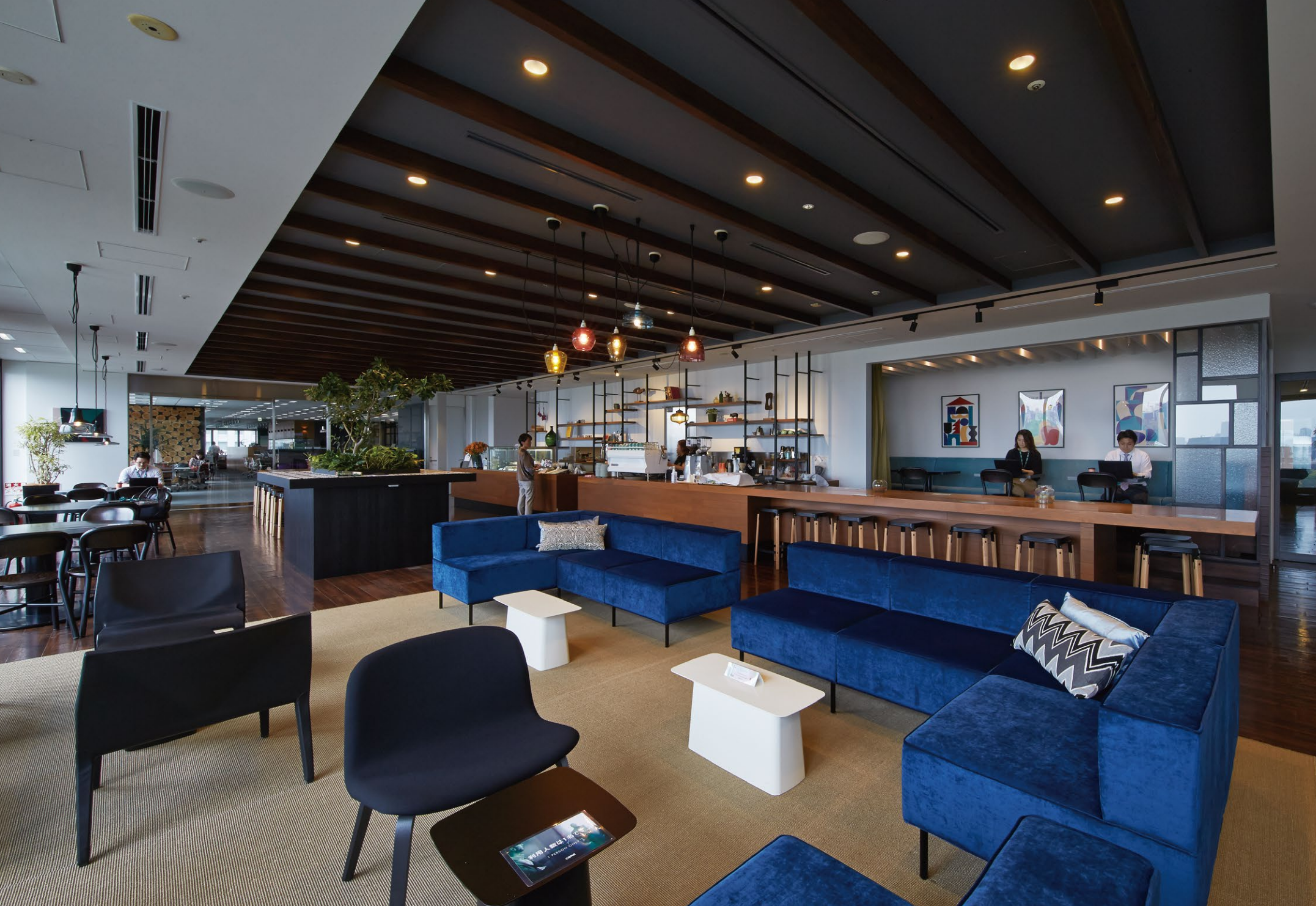
交流の場と位置づけられた“RISE Café”にはラウンジ機能が強化されエアリーソリューション(写真右)が導入された