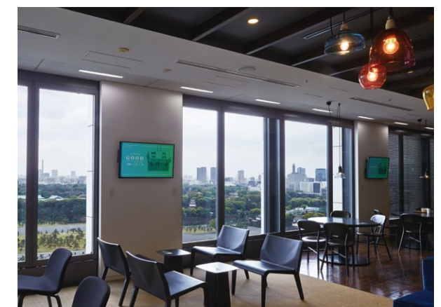
カフェ全体の空気質(温熱快適性・空気清浄度)を見える化するサイネージ