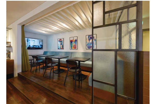
天井からのダウンフロー気流により浄化した空気を循環させるエアリーソリューション

■社内カフェ改修工事 所在地／東京都千代田区丸の内 事業主／シービーアールイー株式会社 建築工事／株式会社竹中工務店 内装工事／株式会社丹青社 改修竣工／2020年12月