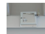
利用状況を計測する熱線センサ