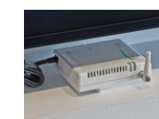
Café中央に設けられた温湿度センサ