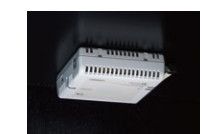
CO 2 センサ