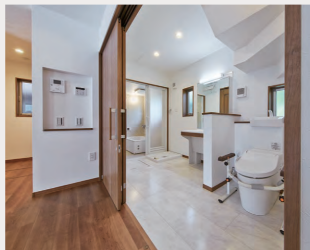
介護も容易なようにスライディングドアの背後に並列配置された、高齢者施設向けユニットバス アクアハートとアクアハート洗面、NewアラウーノV