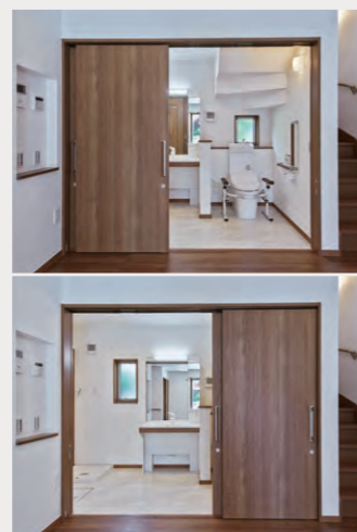
3枚扉のスライディングドアは、トイレ、洗面のどちらからでも大開口が可能

所在地/東京都多摩市 設計・施工/松本設計ホールディングス株式会社 竣工/2021年5月