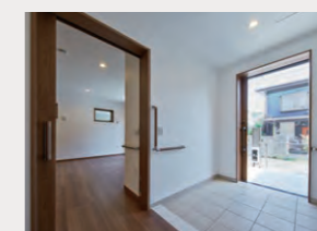
車いすが回転できるように直径1.5mが確保された玄関