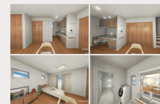
施主様への空間説明に利用した360度バース