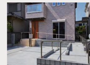
一人でも車いすで上れるように1/14勾配に設定されたスロープ