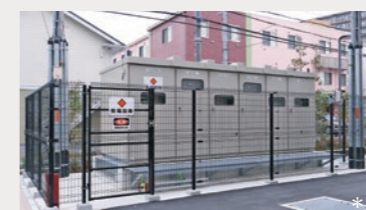
エリア一括受電だからこそ可能な常用線と予備線の2回線引込により、まちとして停電時のリスクを軽減