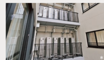
1台のエネファームを数戸で共同利用するシェアリングエネファームで熱を有効活用