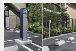
EV普及に対応して設置された37台分の電気自動車充電設備