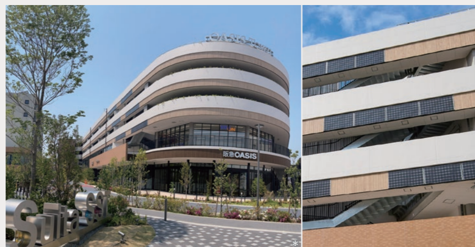
複合商業施設「オアシスタウン吹田SST」(左)と壁面に設置された太陽電池モジュール(右)