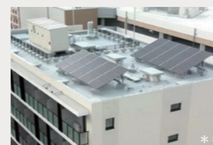
単身者共同住宅屋上の太陽電池モジュール