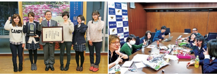
総務省の平成27年度「ふるさとづくり大賞」で、JK課の活動が評価され、鯖江市が総務大臣賞を受賞

2014年、福井県鯖江市で地元のJK(女子高生)が主役になってまちづくりを行う実験的なプロジェクト「鯖江市役所JK課」を提案し、新しい公共事業として採択いただきました。福井県では、18歳で卒業した高校生の約6割が県外に出て行きます。しかし、4割の男子は地元に戻って来るのに対し、女子はその半分しか戻ってきません。地域の人口減少を解消するには彼女たちに残ってもらうことが大切です。そこでJKと市役所職員のコラボを考えたのです。