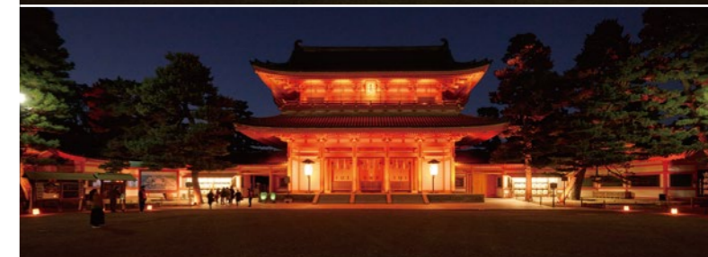
Yellow Green (上)、Orange (下) にライトアップされた應天門