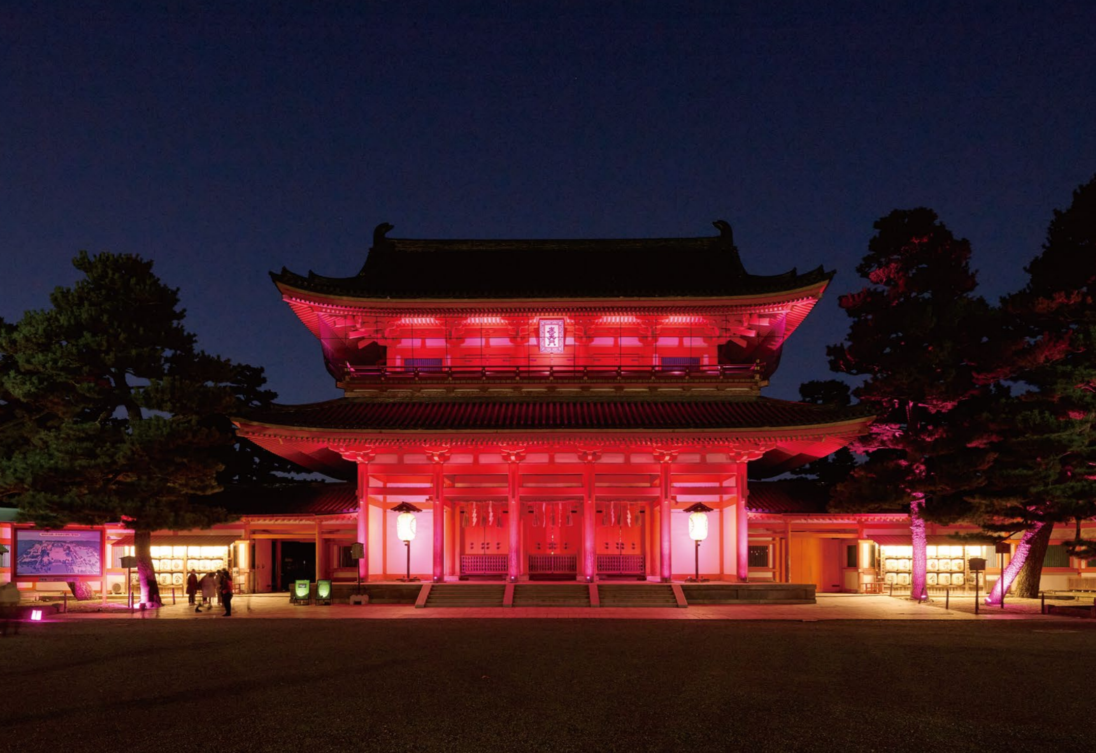
「体験型演出 YOI-iro」により、スマートフォンから誕生日を送信すると、應天門や行灯、松の木が誕生日カラーでライトアップされる(写真はMagenta)