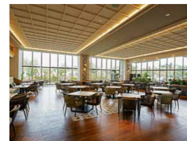
時間によって調光演出が行われるレストラン「オールデイダイニング ジノーン」

所在地 / 沖縄県宜野湾市真志喜 運営 / 株式会社西武・プリンスホテルズワールドワイド 形態 / ケネディクス株式会社との定期建物賃貸借契約 設計 / 清水建設株式会社一級建築士事務所 施工 / 清水・松村 特定建設工事共同企業体 電気工事 / 株式会社関電工 開業 / 2022年4月 規模 / 地上14階建、延床面積:約29,211㎡