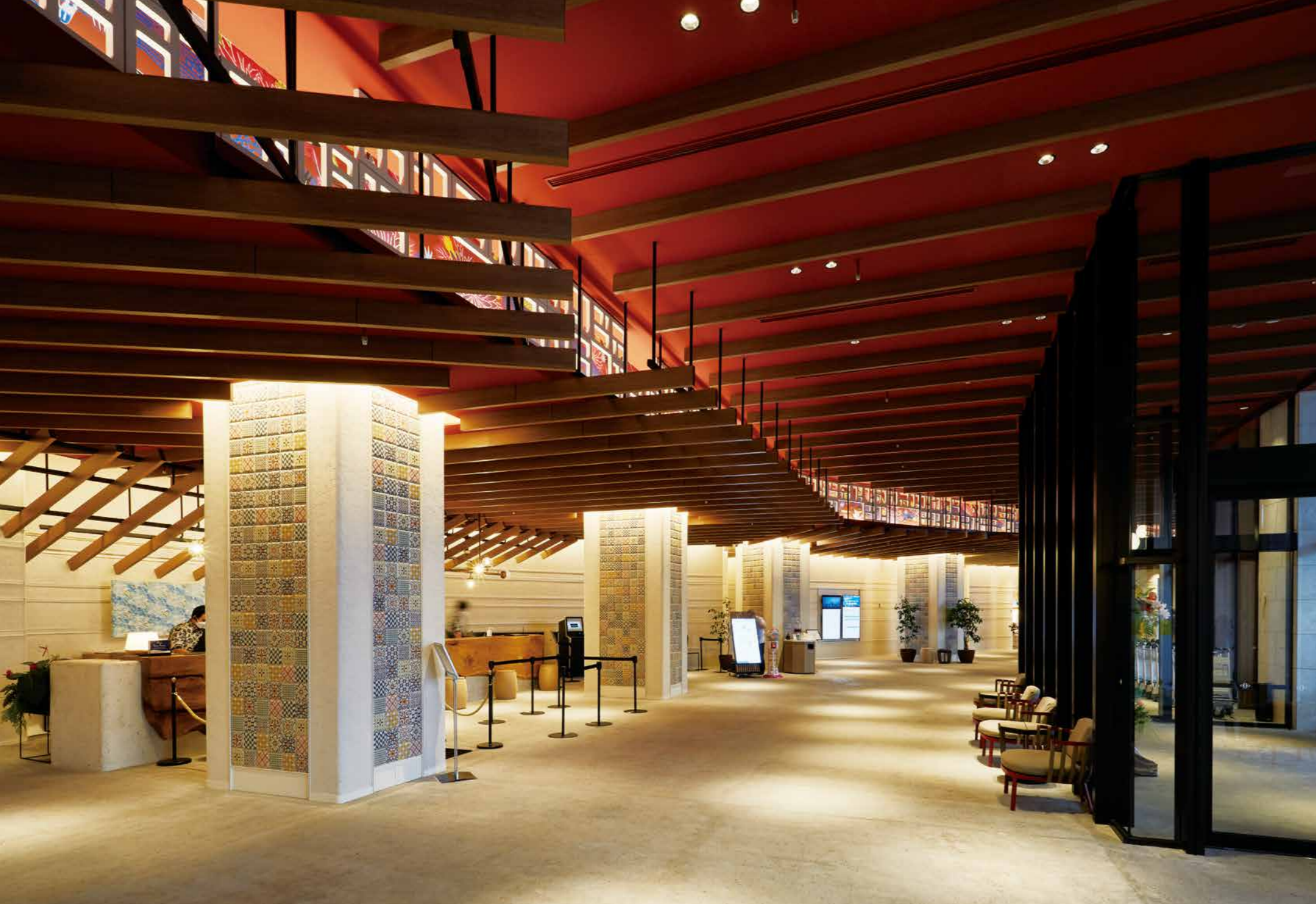
時間によって間接照明とダウンライトによる調光演出が行われる1階ロビー