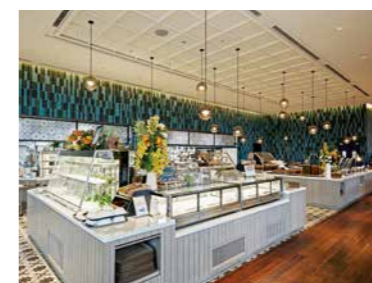
ビュッフェコーナー上部の丸型ペンダントライト