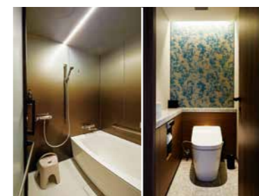
スーペリアフロア客室のバスとレストルーム