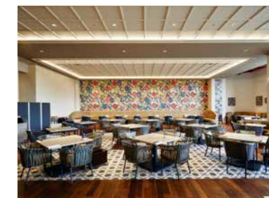
紅型作家によるデザインで彩られたレストラン壁面