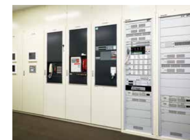
防災センターに設置された、空調・防災・非常放送など、各種ビルシステムの自立盤