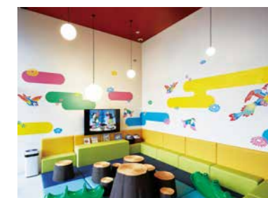
壁が紅型のデザインで彩られたキッズルーム