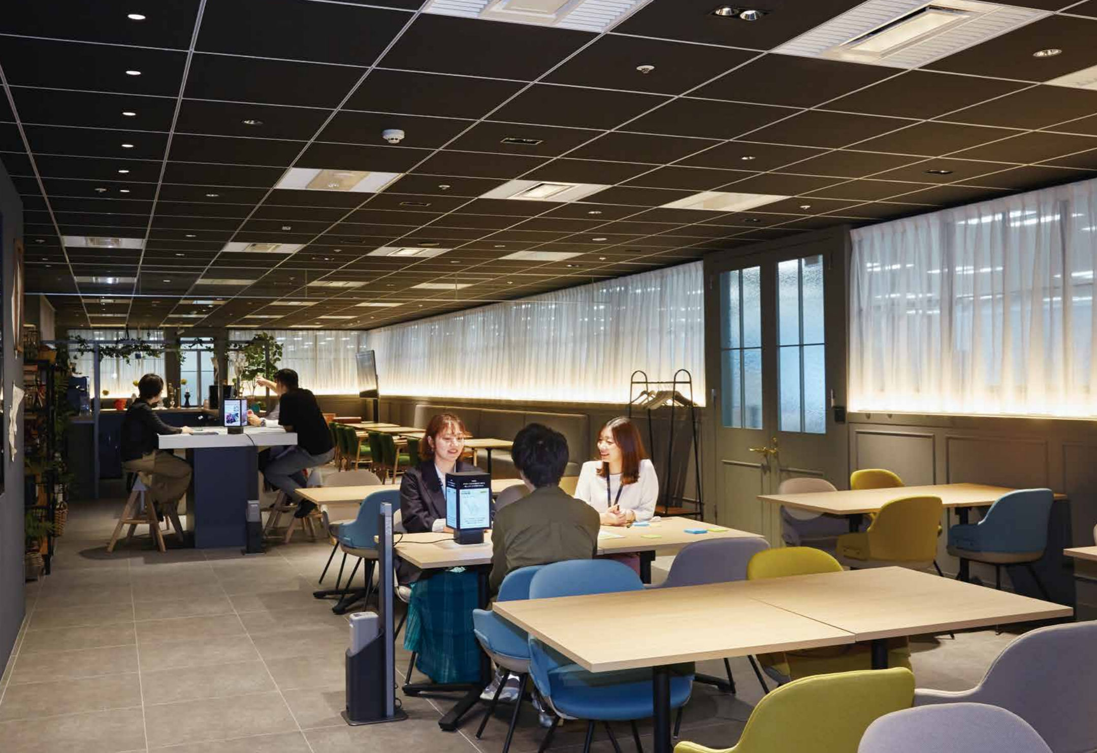
執務室の横に配置されたイノベーションルーム。背後にあるのが「メルティカフェ」。設置された2台の「ランターナ」はインテリアに合わせた黒。隣の執務室には白タイプを8台導入