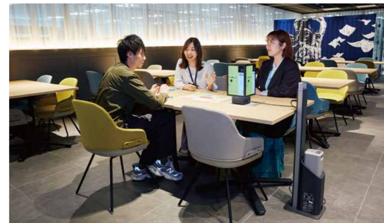
ワークショップでアイデアやプロトタイプを表示する「ランターナ」は人の輪の中に置けるので、メンバーとの距離も縮まり会話も弾む

■ランターナ導入 所在地 / 神奈川県横浜市神奈川区金港町 事業主 / 株式会社NTTデータMSE 設置 / 2023年4月