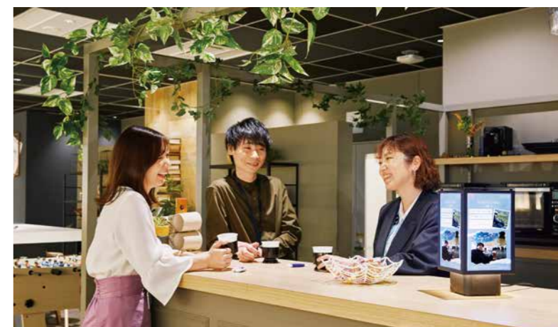
「メルティカフェ」で社員などの自己紹介を流す「ランターナ」がコミュニケーションを活性化