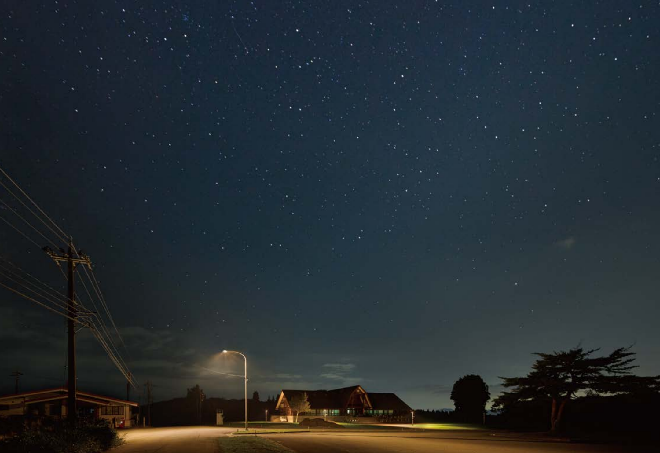
「ミルク工房奥越前 六呂師高原の時計台」前には、美しい夜空に影響する光害を抑えた、DarkSky認証道路灯が設置されている(上方光束率0%、色温度3000K以下)