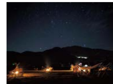
星空を楽しむイベント「星空ハンモック」