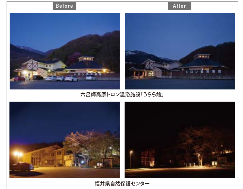
光害を防ぐDarkSky認証照明器具や光害対策照明器具によって上方光の光漏れが抑えられた各施設