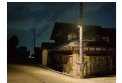
地域の安全だけでなく星空も守るDarkSky認証防犯灯