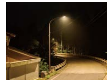
生活に必要な明るさを確保しながら光害を抑えるDarkSky認証器具に置き換えられた道路灯