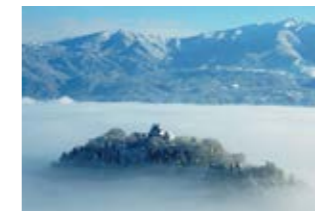
天空の城 越前大野城

※2 2020年1月、パナソニックの光害対策型LED防犯灯・道路灯が日本メーカーで初めてIDA(現DarkSky)の認証を取得