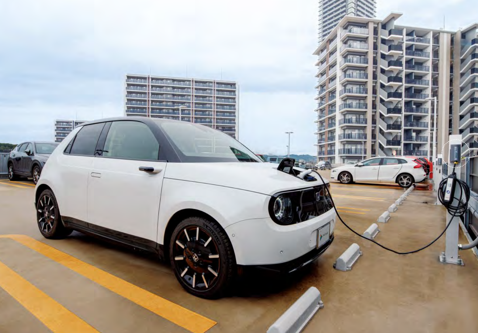
マンション駐車棟の全429区画に設置された、個別に基礎充電できるEV充電用3kWコンセント