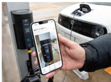
EV充電用コンセントの二次元コードを読み込むとEVへの基礎充電が始まる