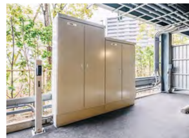
EV充電用コンセントを個別にON/OFFし、消費電力情報をクラウドに送る制御装置