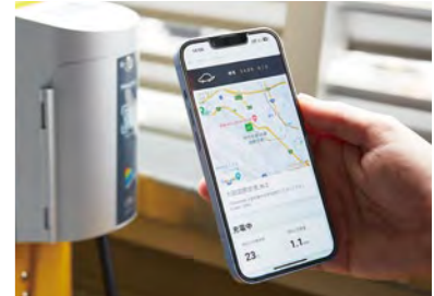
EV充電用コンセントの二次元コードを読み込むと基礎充電が始まり、充電場所がアプリに表示される