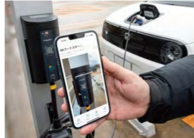
EV充電用コンセントの二次元コードを読み込むとEVへの基礎充電が始まる