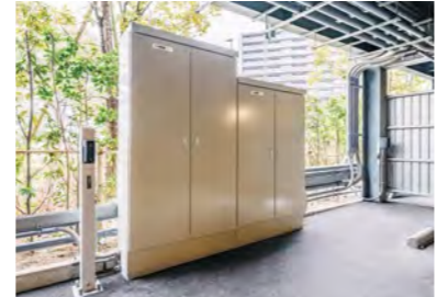
EV充電用コンセントを個別にON/OFFし、消費電力情報をクラウドに送る制御装置