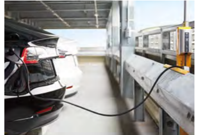
EVユーザーは所有するケーブルを用いてEV充電用コンセントに接続

ユビ電株式会社は、関西エアポート株式会社が運営する大阪国際空港駐車場に、国内空港で最大規模のEV充電用コンセント184基を設置。2024年春頃からEV充電サービス「WeCharge」の提供開始を予定している。これまで、空港にはわずかな急速充電器が設置されているだけで、空港到着後には充電車室に移動して充電完了を待つ必要があった。今回は予約可能な184車室全てに3kWのEV充電用コンセントを設置することにより、12時間の駐車で約250km走行可能になる。航空機利用者は、空港出発時にEVを駐車しておけば、航空便を利用して再度空港に戻ってきた時には、充電したEVをすぐ利用できるため、利便性が高まると期待されている。