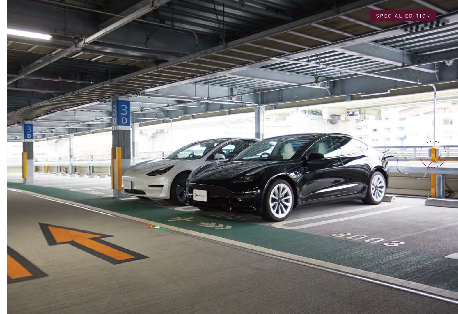
大阪国際空港の北立体駐車場①3階(84車室)および、南立体駐車場2階(100車室)、全184車室に設置されるEV充電用3kWコンセント(写真は北立体駐車場①3階)