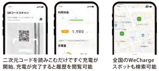
二次元コードを読みこむだけですぐ充電が開始。充電が完了すると履歴を閲覧可能