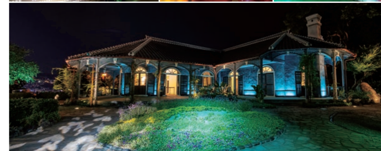
スマートフォンでパネルのQRコードを読み取ると、スマートフォンに表示される色にあわせて旧グラバー住宅を彩る照明の色が変わり、蝶が現れる