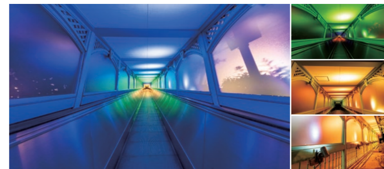
(左) 現代から明治時代へと来園者を誘う「動く歩道」の照明演出 (右上・中) 次々に色に変化する照明 (右下) 照明演出に使われるDMXスポットライト