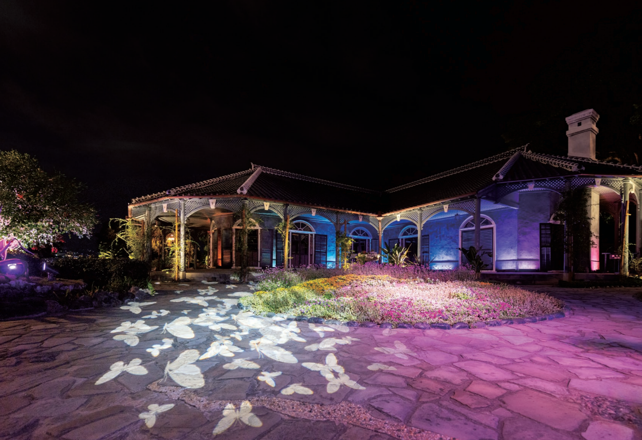
街演出クラウド「YOI-en」の照明が旧グラバー住宅の建築美を引き立たせながら、明治時代をイメージした光の色合いや蝶々夫人の生涯を表現