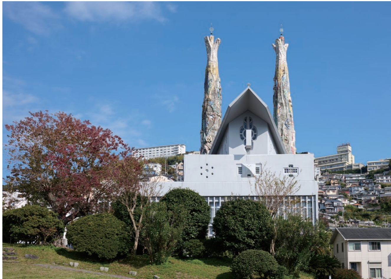
長崎市西坂に建つ聖フィリッポ教会。高さ約16mの双塔をガウディ作品を思わせる陶片モザイク「フェニックス・モザイク」が彩る。

長崎県長崎市の聖フィリッポ教会は、アントニオ・ガウディを日本に紹介した研究者で、その手法を実践した建築家・今井兼次の設計。1962（昭和37）年に竣工し、ガウディを彷彿とさせる陶片モザイクの2本の塔を特徴とする。長崎市の景観重要建造物。DOCOMOMO選定。