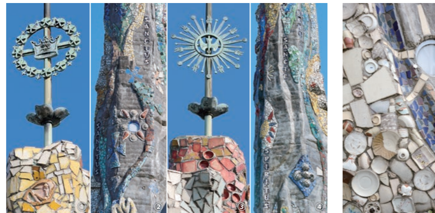
陶片モザイクが美しい塔頂。その上部に①聖母マリアを象徴する王冠③聖霊を表すハトの装飾を頂く。②④塔身にはラテン語で祈りの言葉が書かれている。