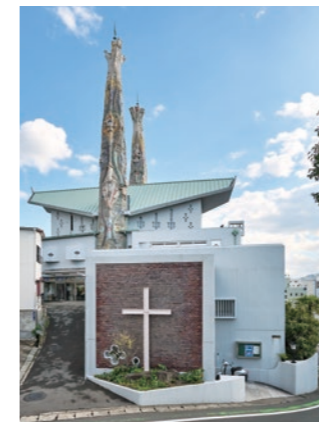
緩やかな坂の途中に建つ聖フィリッポ教会。左手奥に入口がある。