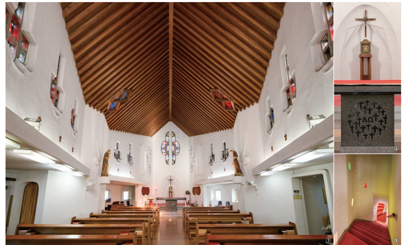
①静かな聖堂内に十字架やハトの形のステンドグラスから外光が差し込む。木組みの天井には双塔につながる開口部が見られる。聖歌は天井に反響し、降り注ぐように聞こえるという。②十字架を囲む装飾は聖母マリアのマントをイメージしたもの。③聖堂とエントランスを結ぶ階段は2つ。こちらは神父が使う。

長崎市西坂地区は、豊臣秀吉によるキリスト教禁制下の1597（慶長元）年に宣教師や信徒など26人が処刑された殉教の地。彼らはアジアで最初のキリスト教の殉教者であり、イエス同様に十字架にかけられたことから、当時、ヨーロッパでも大きく注目された。1862（文久2）年、26人はローマ教皇によって聖人に列せられ、その約100年後にあたる1962年に聖フィリッポ教会と日本二十六聖人記念館が今井兼次の設計で建てられた。聖フィリッポ教会を特徴付けるのは、コンクリートの表面に陶片モザイクをちりばめた