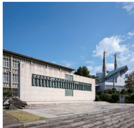
彫刻家・舟越保武作のレリーフをはめ込んだ日本二十六聖人殉教記念碑（手前）と、日本二十六聖人記念館（左奥）。

双塔の直線的ではない複雑なフォルムや陶片モザイクは、図面だけで現場の職人たちに制作させるのが困難であったため、今井は粘土模型を作って対応したという。聖堂内は小ぶりながらも厳かな雰囲気漂う空間。天から下降するハトや十字架を象った窓を、カトリック教会では珍しい幾何学模様のステンドグラスが彩っている。今井は26の十字架と永遠の神を表すA・Ωを刻んだ祭壇、彫刻を施した木製扉などもデザインした。教会は今も大切に受け継がれ、日本語や英語によるミサが行われている。