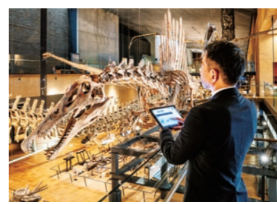
タブレットにより1灯ごとの照度と色温度を調整