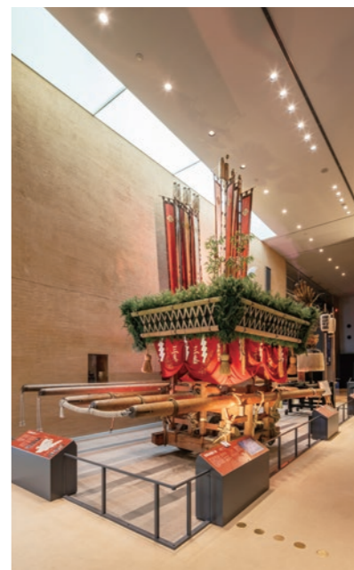
カルチャーモール(歴史ゾーン)のダウンライトは笹山笠の幟部分の照度を抑えて調光

いのちのたび博物館 ■照明設備LED化工事 所在地 / 福岡県北九州市八幡東区東田 事業主 / 北九州市 設計 / 共同設計 電気工事 / 株式会社三協電気 リニューアル工事竣工 / 2026年3月 規模 / RC造3階建(敷地面積:約31,000㎡、延床面積:約17,000㎡)