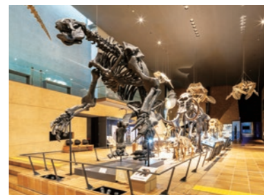
照射角を調整して顔が明確になったエレモテリウムの骨格見本