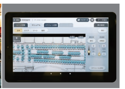
「WiLIA」タブレットの操作画面