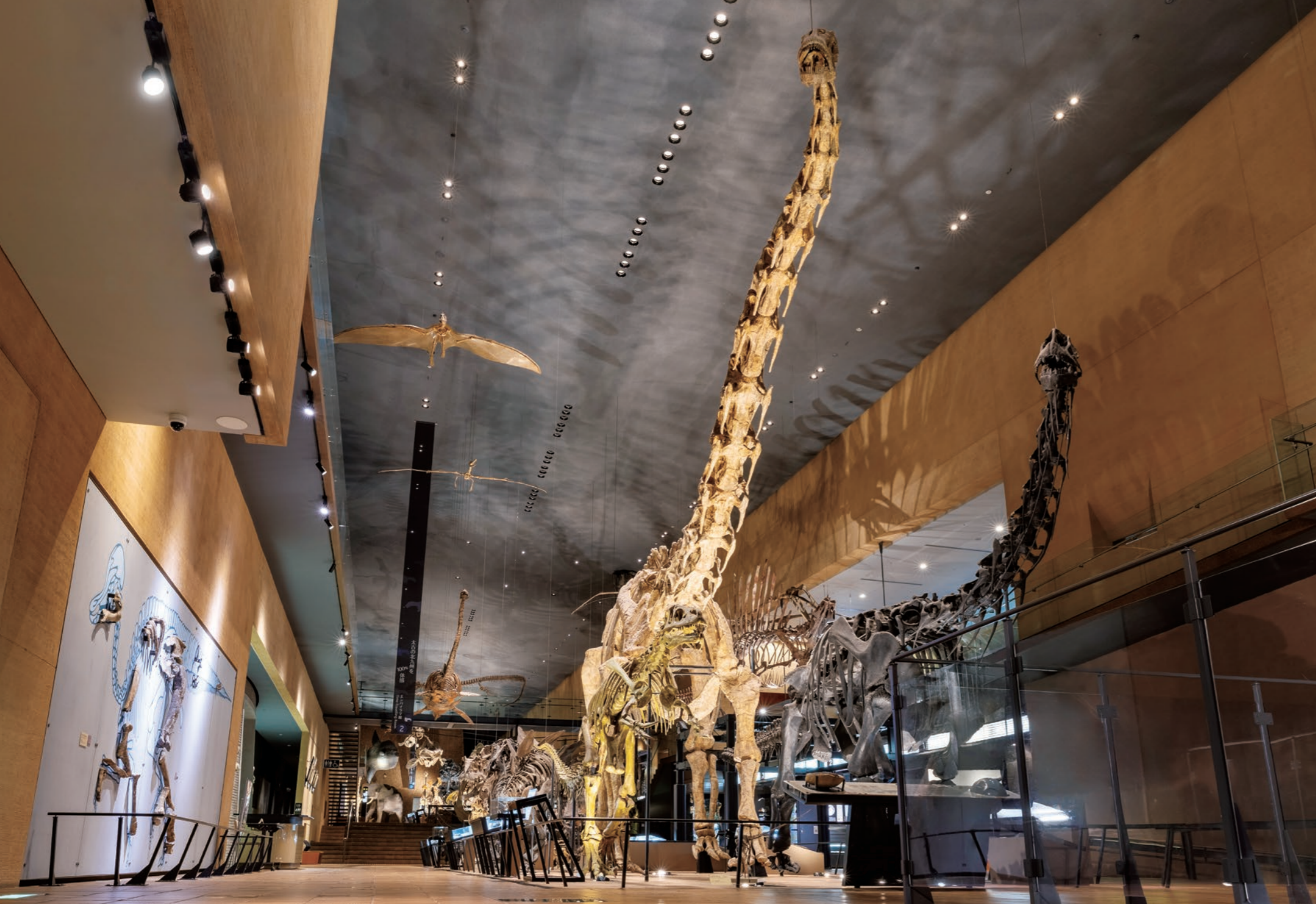
入口から奥に進むことで、時代順に古生代・中生代・新生代に生きていた生物の展示が見学できる自然史ゾーンのアースモール。天井の壁際のダウンライトがユニバーサルダウンライトに更新された