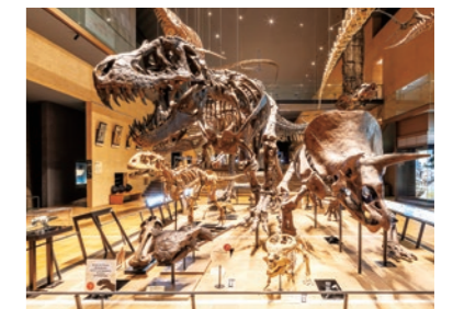
ティラノサウルスの顔を立体的に照射するユニバーサルダウンライト