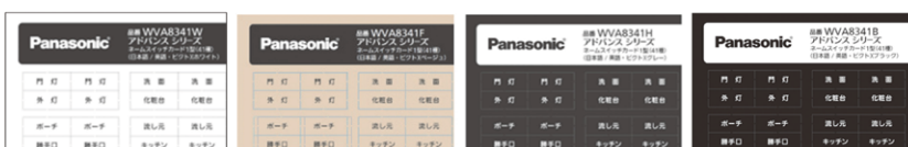
<ホワイト> <ベージュ> <グレー> <ブラック>

②ハンドル色に合わせたカラー展開および読みやすいフォントを採用し、視認性およびインテリアとの調和性を向上