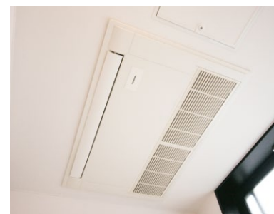
マルチ高天井1方向天井カセット形(工場特注仕様)