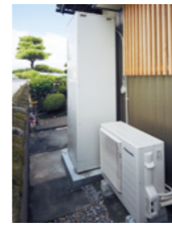
Aさま邸に導入されたエコキュート。

思っていたより安くて驚きました。以前はお風呂と料理でガスをたくさん使っていたのを実感しました。オール電化にして丸々ガス代が浮いたんです。料理では煮炊きものをすることが多いので、そのせいもあるのですが、エコキュートにしたのでお風呂のガス代がなくなったことも大きいと思います。オール電化のおかげでさらに節約できると思うと、楽しみです。