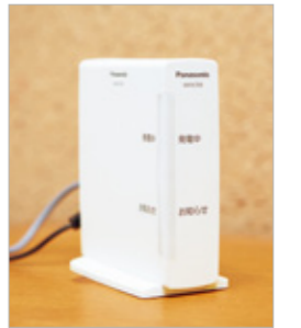
機器ごとの電気代がわかるAiSEGも設置。

かった。今は気にせず使っています。それから、これまでは電力会社の検針票で、家全体の1ヵ月分の電気使用量がわかるだけだったのが、「スマートHEMS」なら機器ごとの電気代がわかって、何にどのくらい電気を使っているか見えるのがうれしいですね。電気使用量が見えることで、家電を使う時間帯なども意識するようになり、食器洗浄機はタイマーをセットして電気代の安い時間帯に動かしたりして、節電を心がけています。