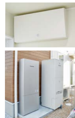
電気をつかって、ためる、かしこく使うことができるZEH基準をクリアしたモデルハウス。

私たちは三重の地元ビルダーですので、三重の良い所を取り入れた風通しの良い住宅や、エアコンの遠隔操作、蓄電池による災害時のエネルギー対策などをご紹介します。独自のZEHとしてご提案しています。また、これからは国の施策としてZEHの標準化が求められますので、その基準をクリアするための省エネ性・断熱性・電気をつくる・ためる・見える化などの充