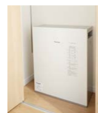
災害時に役立つ蓄電池は、お客さまの関心度も高い。

HEMSについてもご存じない方も多く、見える化の説明をする際は、分岐回路の設定でお部屋ごとの電気使用量が見られるので、「電気はどこでたくさん使っているか一目瞭然ですよ」とお伝えしています。モニター画面を一緒に見ながらご説明していますので、例えばエアコンをオフにして電気使用量が下がるのが見えると、すぐに理解いただけますね。お子さま連れの方は、画面のペンギンにお子さまが興味を示されるので「節電教育にもいいね」と言われます。さらに、エアコンをスマートフォンで操作できることに関心を持たれる方は多いです。