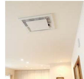
天井に埋め込むことにより、お子さまがぶつかるなどのトラブルも防げる。

宮本 太陽光発電システムや蓄電池、エアコンやエコキュートなど、さまざまな設備機器とつながることですね。例えば、AiSEGと天井埋込形空気清浄機が連動することで、ハウスダストやPM2.5を数値化しながら空気清浄機を運転できるのが良い点だと思います。