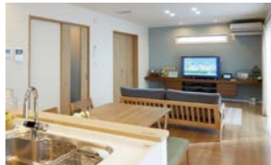
三重の気候や風土にあわせて設計しているスマートエコヒルズ道伯のモデルハウス。

宮本 電気をつかってためる、太陽光発電システム・創蓄連携システム・スマートHEMSを利用したZEHのモデルハウスです。お客さま目線でエネルギーのことを考え、あったらいいな、できたらいいなの実現を目指して取り組んでいます。