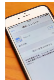
外出先からシャッター操作ができる「スマートHEMSサービス」の機器コントロール画面。