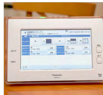
AISEG2の機器コントロール画面。電動窓シャッターの開閉操作をタイマー設定しておけば、居るふり防犯にも役立つ。

0さま 専用アプリの「スマートHEMSサービス」を使うと、外出先からでも操作ができることです。例えば、シャッターを閉め忘れたときやゲリラ豪雨のときなど、スマートフォンでシャッターの状態を確認して閉めることができるのは助かります。