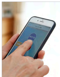
窓を開けずに、家の中からスマートフォンでシャッターの開閉ができる。(写真は文化シャッター製のアプリです)

吹き込んだりしていたけれど、今は専用リモコンやスマートフォンを使って窓を開けずにワンタッチでシャッターの操作ができて快適です。これまでは夜遅いときなどガラガラという音が近所に響いて気になっていたのですが、電動窓シャッターは静かで音が気にならず、リフォームしてからシャッターに関するストレスがなくなりました。