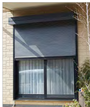
電動窓シャッターを半開にして、日差し以外にも活用できる。

0さま 窓からの日差しが気になったら、ちょうど日差しを遮る高さまでシャッターを下ろせるのが便利ですね。特に、外出前の忙しいときにシャッターを閉める手間もなくなりました。それから、タイマー機能もよく使っていて、私の住んでいる地域の日の出・日の入り時刻に合わせて、自動で開閉してくれる機能は特に重宝しています。