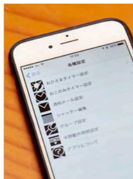
電動窓シャッターのアプリから各種設定ができる。(写真は文化シャッター製のアプリです)