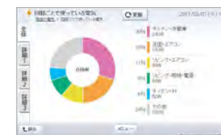
スマートHEMSのエネルギー管理画面。