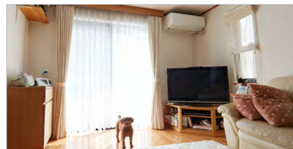
電動窓シャッターにリフォームした0さま邸のリビング。

0さま わが家は築12年で、もともと手動の窓シャッターが2台ありましたが、最近では新築のころに比べて窓シャッターの開閉が少し重く感じるようになっていました。そこで、ただメンテナンスをするよりもっと便利で快適な窓シャッターがないかと探していたときに、文化シャッター製の「電動窓シャッター」を知りました。私が魅力的に感じたのは、家のどこからでもスマートフォンで開閉ができて便利なことと、体に負担がかからないことです。さらに、パナソニックの「スマートHEMS」とつなげば、家の外からの遠隔操作ができることにも惹かれ、両方を導入しました。