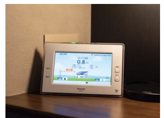
室内に設置されたAiSEG2。

特に注目したのは、子どもの安心を確認する機能。例えば、人感センサーでダウンライトが点灯することで子どもの帰宅をスマホに通知してくれる機能は、子育て世代に大きく響いたようです。私どもが思っている以上に、生活者のニーズにマッチした商品であると感じました。お客さまに対する提案の幅が広がり、当社にとってAiSEG2採用はメリットになっていると思います。