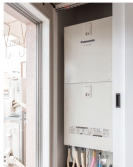
AiSEG2とエコキュートの連携で、遠隔操作やエネルギーの見える化が可能に。

また築40年の建物ということでは室内の電気容量についての質問が多く、ブレーカーが落ちるのを防ぐピークアラーム機能も好評でした。