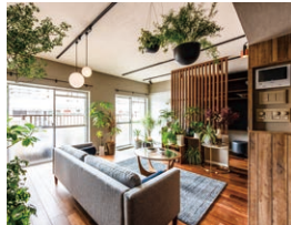
「家族全員が笑顔になれる家づくり」をコンセプトにリノベーション事業を展開されています。

AiSEG2は「Enjoy at Home」になくてはならない設備になってくると私は考えています。