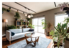
モデルルームの内観。