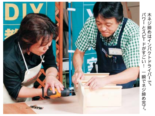
木ネジ締めはインパクトドライバーで。パワーとスピードがすごい！一瞬でネジ締め完了。