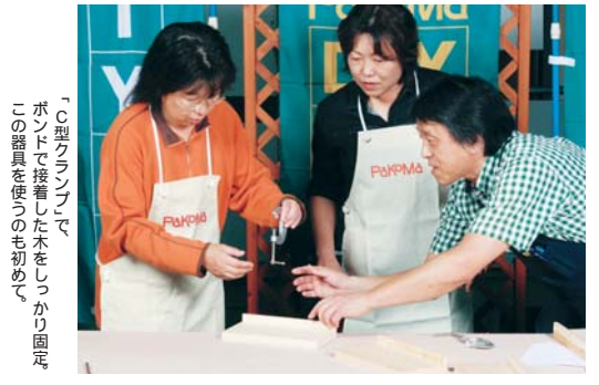
「C型クランプ」でボンドで接着した木をしっかり固定。この器具を使うのも初めて。