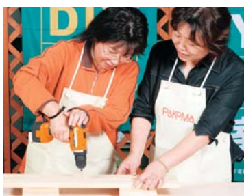
ドリルドライバーで下穴あけもスイスイ。板に直角に当ててね。

チ・オフの状態でも手締めもでき、最後の締めが確実にできます。木ネジを締めるのは、インパクトドライバーで。こちらは、上からたたき込むハンマー機能とネジ締めパワーを同時に発揮するスケジュールです。板に直角に当て、しっかりと握って、慣れるまで最初はゆっくり締めっていくのがコツとアドバイスを受け、1、2度練習したふた