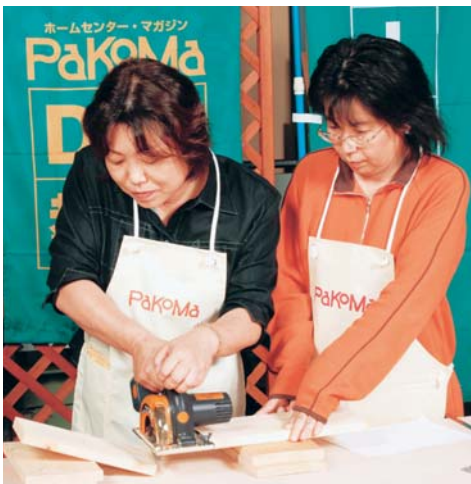
アッ、木のカットが一瞬でできちゃった! パワーカッターに初体験。

大掃除シーズンに向けて、トイレの中の小物収納にぴったりのスリムラック作りは魅力的で、ふたりで頑張っただけで、意欲的に参加しました。まず最初は、充電パワーカッターで木材をカットするところからスタート。初めての電動工具に最初は緊張感がたよ