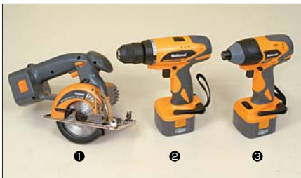
【電動工具】①充電パワーカッター ②充電ドリルドライバー ③充電インパクトドライバー