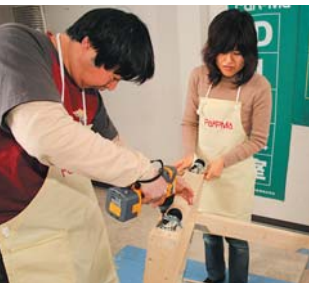
ご夫妻の息ぴったり！二人でやれば作業の進行も早い早い！