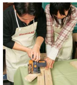
木のカットが一瞬で。思ったよりカンタンに使えるパワーカッター。