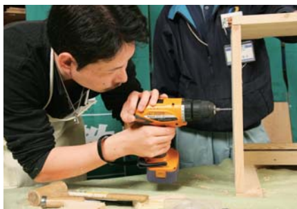
ドリルドライバーの木工用ビットで、ダボ処理用の丸穴あけ。