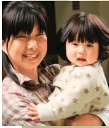
柚月(ゆづき)ちゃんも パパとママを応援しました。