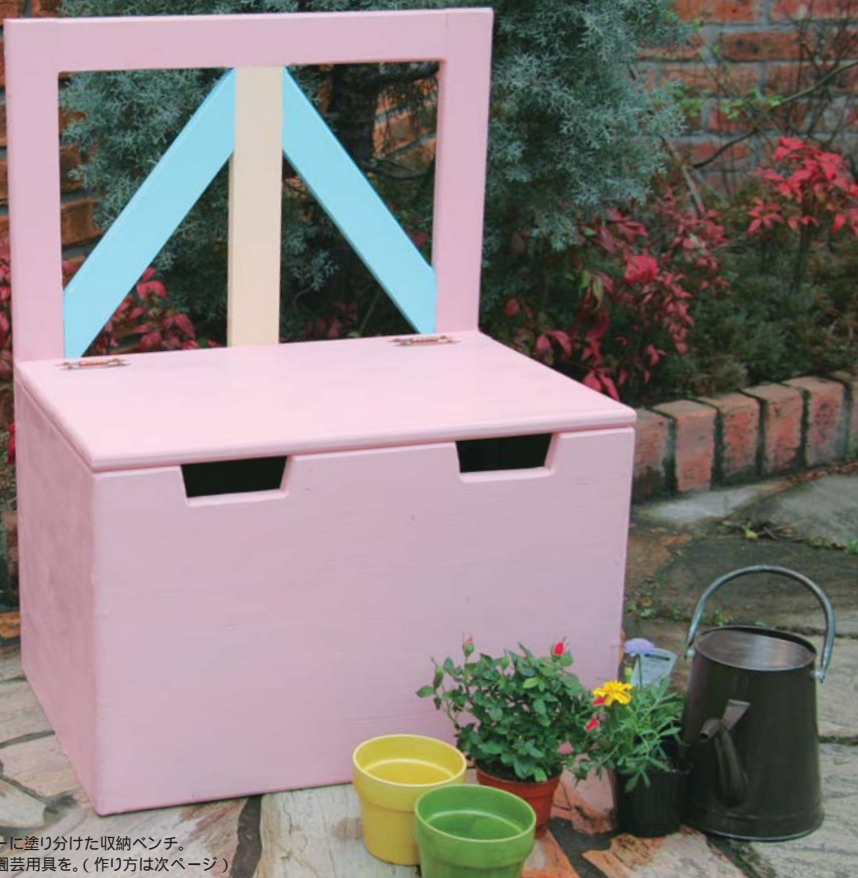
パステルカラーに塗り分けた収納ベンチ。 座板の下には園芸用具を。(作り方は次ページ)