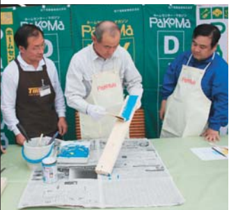
子どもころの工作の時間を思い出すなあ。