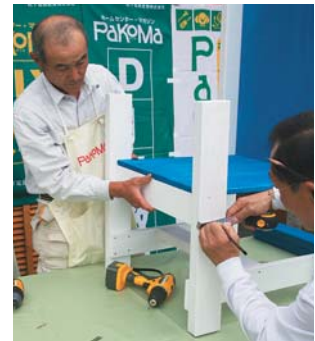
イスは、4本の脚が水平になるよう、サイズをきちんと測って。