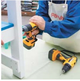
前脚を取り付ける。