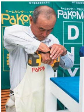
インパクトドライバーがあれば長い木ネジ締めも一瞬でできる

な真 初めて使った大森さんは、「このパワーはすごいですね。今までネジ締めはドリルドライバーで十分と思っていたけど、一度使った力の差