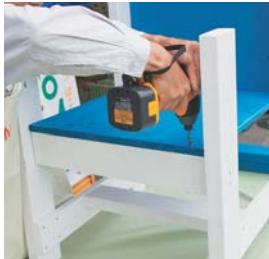
背板の下部に、下から座板を取り付ける。