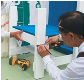
座板の前部下に、座板受けの横木を取り付ける。