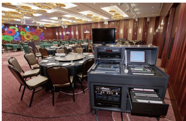
レクチャー卓(右側)に組み込まれたパステルプレノ