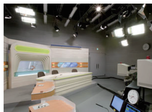
ニューススタジオ