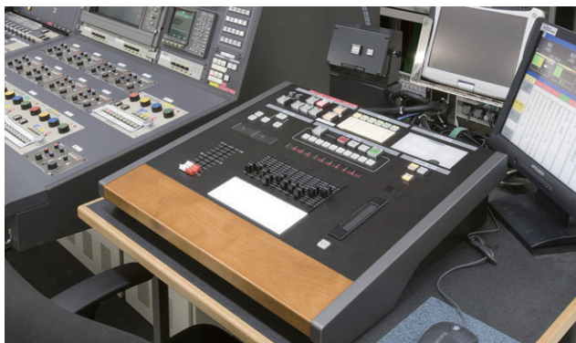
ニューススタジオ調光操作卓