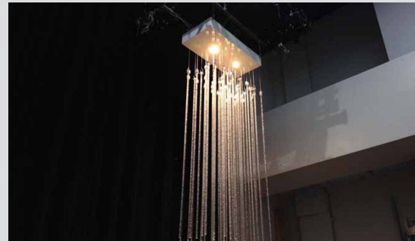
シャンデリアモックアップ