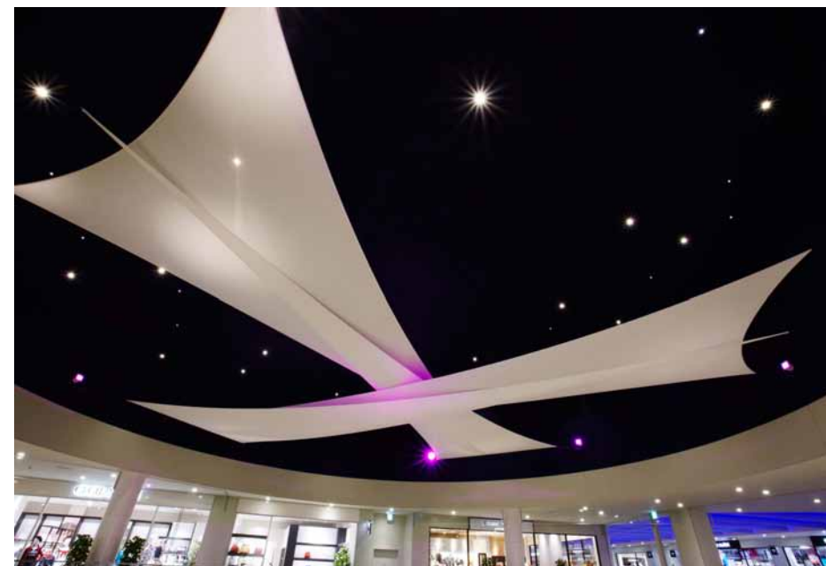
吹き抜け空間はRGBによる演出で天井の膜を照らし上げ、演出効果を出した。

共用部は基本的にワンコアLEDダウンライト等を配置。色温度は3500Kで設定し、落ち着きがありながら活気ある空間を演出している。