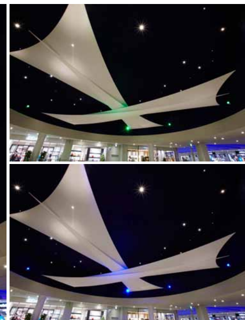
左：レッド 上：グリーン 下：ブルー