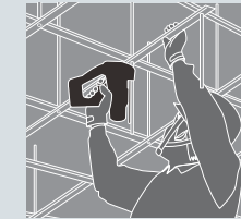
ベース照明の取付に