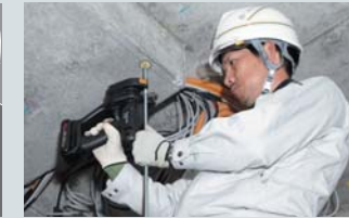
配管支持具の取付に