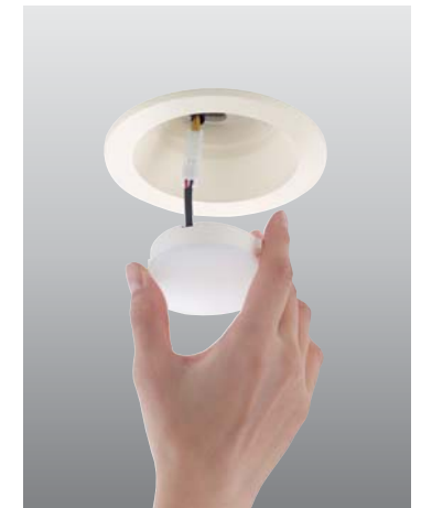
約300品番 希望小売価格 7,800円~21,800円(税抜)