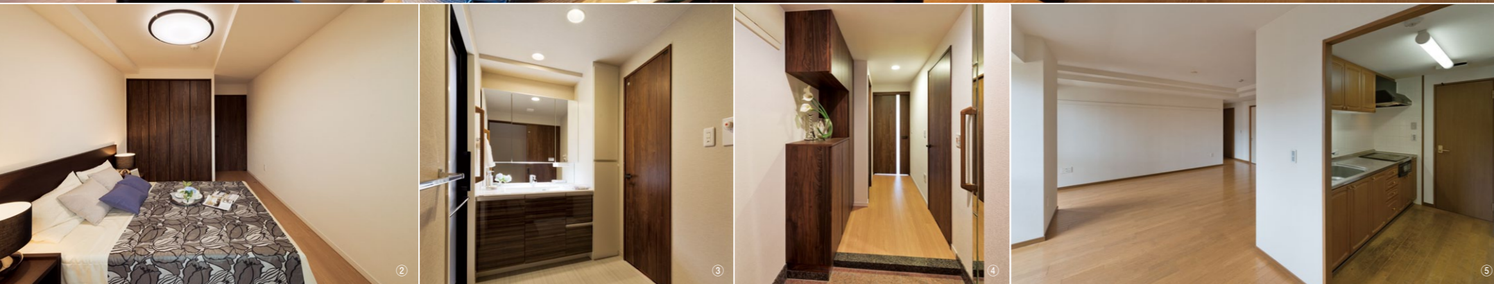
改修後 ①キッチンアイランドタイプにして広々としたLDKに ②改修後の主寝室(写真下)