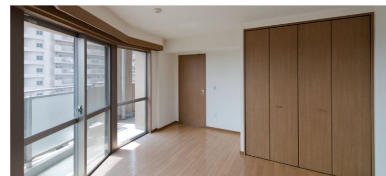
改修前 LDKと洋室の間には壁とクローゼットが設けられていた