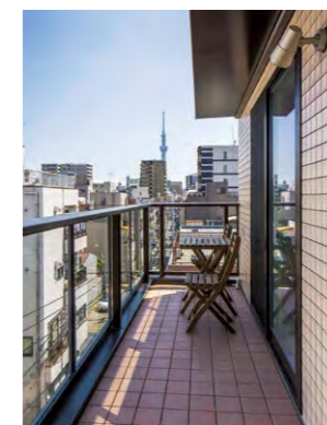
東側の客室には広いベランダを確保