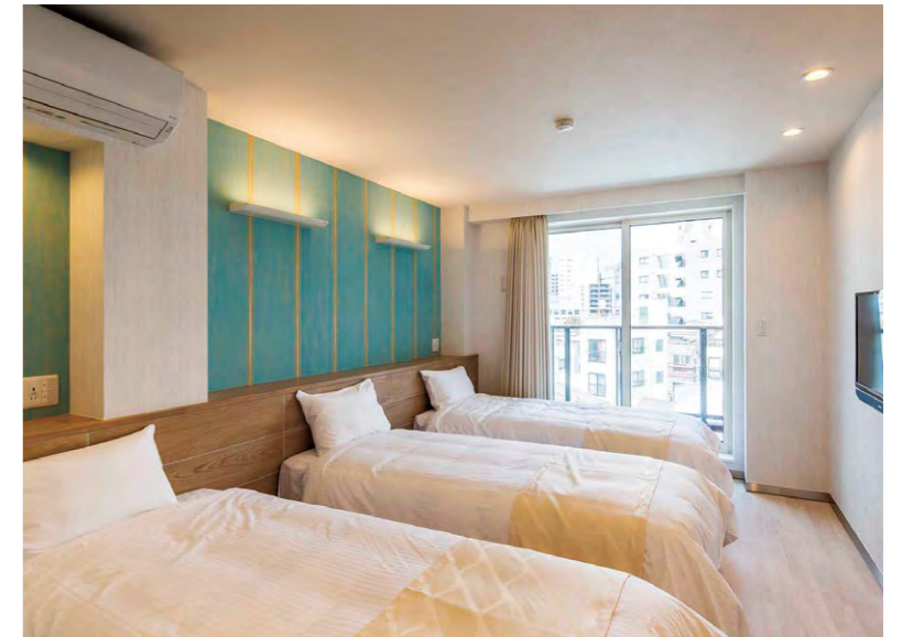
大きな窓とバルコニーが設けられた開放的な客室

所在地 / 東京都台東区三ノ輪 事業主 / エヌエイビル株式会社 運営管理 / ホームディフェンステック株式会社 設計 / パナソニック ホームズ株式会社 施工 / パナソニック ホームズ株式会社 オープン / 2018年4月