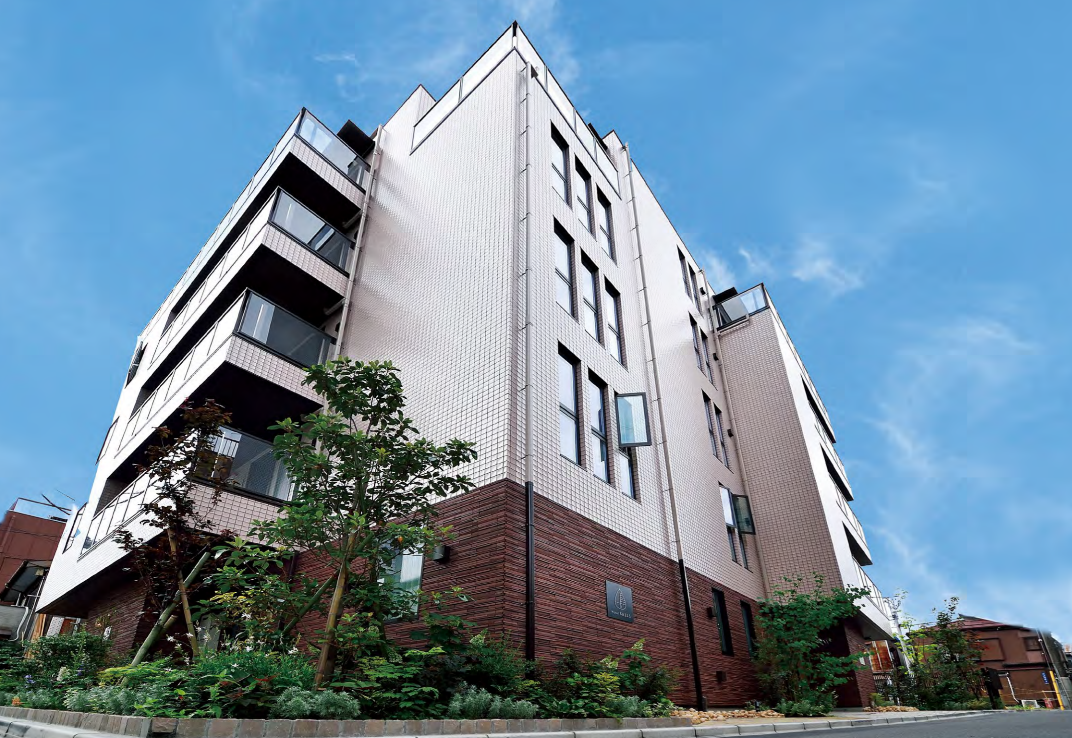
外壁には、汚れても雨で洗い流す光触媒タイル「キラテック」を採用。外壁塗り替えに伴う業務コスト軽減を図り、常に美観を保つ