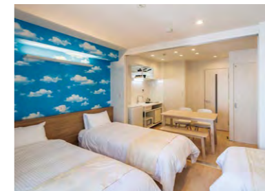
寝台上部には横長のブラケットを設けて照度を確保している