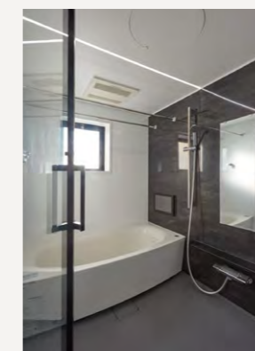
マンションリフォームのために開発されたシステムバスMR-X