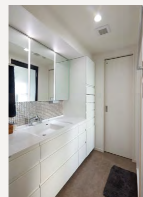
ウォークスルークローゼットにつながる洗面室